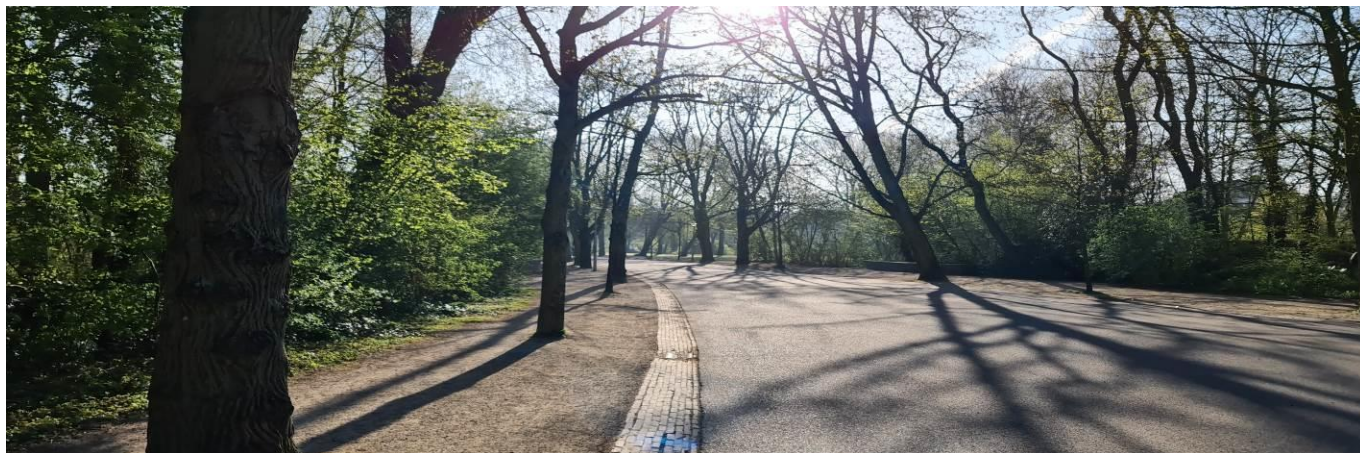
Corona versus Vondelpark